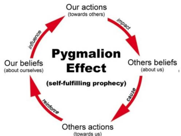
Figuur 1. Verwachtingen als zichzelf waarmakende voorspelling.

En verwachtingen blijken vaak hardnekkig te zijn.